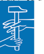
L'Outil en Main

contact avec les enfants et les parents. Quand un jeune en difficulté scolaire reprend confiance grâce à l'atelier, c'est précieux. Des grands-parents m'ont dit : “Ca a tout changé pour lui, il se sent capable.” Ces retours donnent vraiment du sens à notre action.»